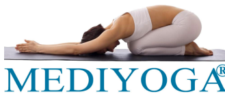
MEDI-YOGA NYT forløb starter snart