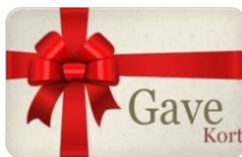
Gavekort til Velværemassage