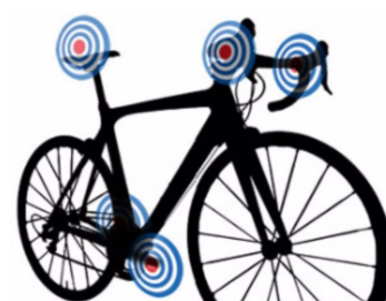
Bikefit. Kom godt igang på cyklen.